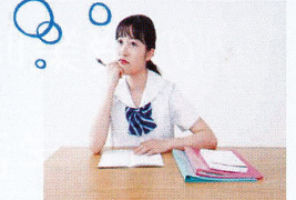
七宝中2年生Aさんの場合